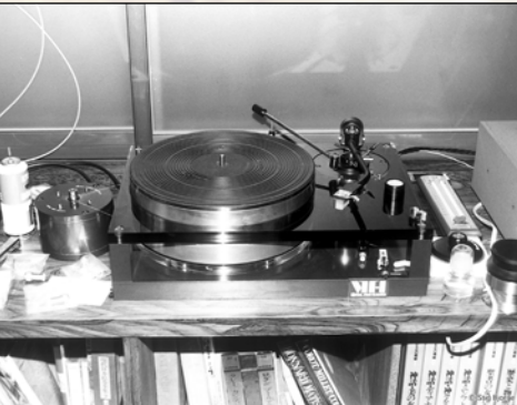
Der Meister hörte bevorzugt mit einem Garrard 401 und diesem archaischen Masselaufwerk: Dem Final Audio Research VTT-1 aus Japan